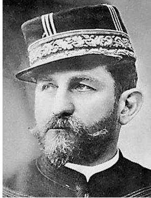
Afb. 4. Generaal Boulanger. 11

Boulanger werd geboren op 29 april 1837 en heeft onder Mac Mahon als generaal gediend. In 1871 maakten zij samen op bloedige wijze een einde aan