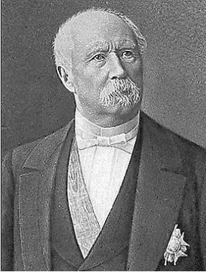
Afb. 3. Patrice de Mac Mahon. 10