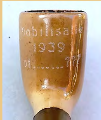
Mobilisatie 1939 tot ...?? (pag. 90)