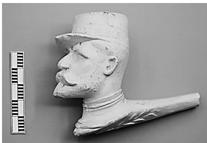
Afb. 2a-b. Pijp met nummer 130 uit de catalogus van P. van der Want, Gouda, ca 1910.

de tweede helft van de 19 e eeuw enorme hoeveelheden verschillende figurale pijpen werden geproduceerd. De op dat moment nog actieve Nederlandse fabrikanten boden in vergelijking hiermee een beperkt aanbod van figurale pijpen en de modellen waren meest niet zelf ontworpen: persvormen hiervoor werden vooral in het buitenland (België en Frankrijk) betrokken op het moment dat pijpenfabrikanten aldaar hun productie beëindigden of een specifiek model achterhaald was door actualiteit en bijvoorbeeld daarmee zijn waarde verloor. De bekendste voorbeelden van ‘geïmporteerde’ figurale vormen en modellen zijn te vinden in het assortiment van Goedewaagen, maar ook de firma’s Prince en Van der Want kochten (figurale) persvormen in het buitenland.