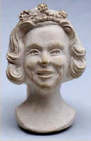
Toevallige ontmoetingen. (pag. 62)