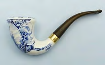
Zenith "vergame Goudse glorie". (pag. 73)