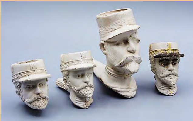
De 'Boulangier-pijp" van Van der Want. (pag.85)