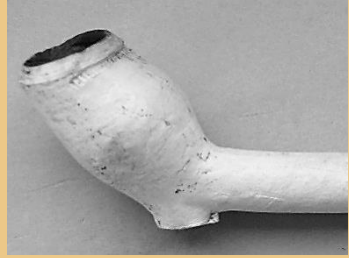
Een bijzondere pijp uit Friesland. (pag. 83)