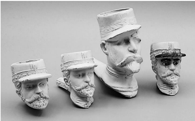
Afb. 6. Van links naar rechts, twee verschillende uitvoeringen (respectievelijk manchetsteel en vaste steel) van Gambier voorstellende 'General Boulanger'. Als derde de Van der Want pijp en geheel rechts dezelfde steelpijp van Gambier maar met emallering.

vanwege een gebrek aan actualiteitswaarde. Wat natuurlijk mogelijk is, is dat de vorm afkomstig is uit een faillissement uit deze periode. De optie dat de persvorm door Van der Want zelf gemaakt is met als doel een aansprekend export product te maken voor met name de Franse markt lijkt echter zeer aannemelijk. Dit laatste wordt mogelijk ook gestaafd door een tweetal andere opvallende aspecten van de pijp van Van der Want. De algehele uitvoering en gravering van de persvorm zijn duidelijk minder fijn en gedetailleerd dan wat we doorgaans bij Franse producten zien. Slijtage van de vorm lijkt in dit geval geen oorzaak van de duidelijk grove uitvoering. Daarnaast zijn ook de afmetingen opvallend. Zoals op afbeelding 6 duidelijk te zien, is de pijp ongewoon groot, met een hoogte van 10 cm is zij bijna twee keer zo groot als de meeste standaard modellen uit die tijd.